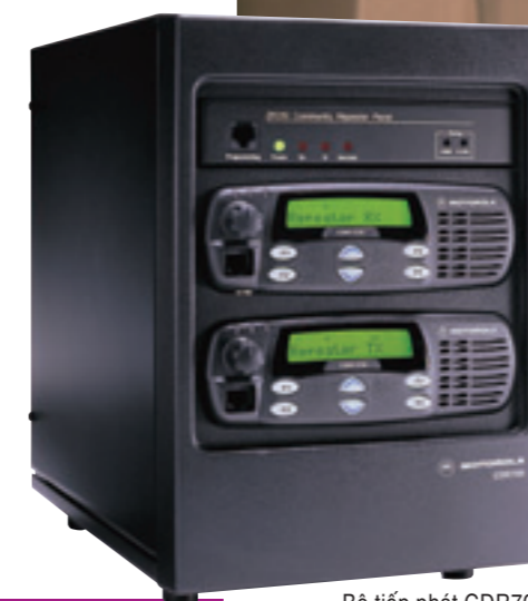
Bộ tiếp phát CDR700